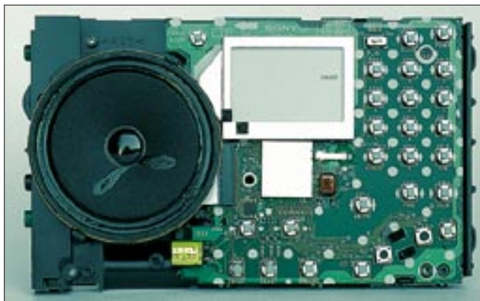
Der nackte ICF-SW7600GR zeigt einen sauberen Aufbau des Doppelsupers auf engstem Raum. Auch sämtliche Regler und der eingebaute Lautsprecher sind fest mit der Hauptplatine verbunden.

Zwei verschiedene Frequenzen lassen sich so programmieren und in eigens dafür vorgesehenen Speicherplätzen ablegen, daß dort der Empfangsbetrieb zu einer minutengenau festlegbaren Zeit für 60 Minuten aufgenommen wird (als „Weckfunktion“; alternativ auch per Weckton). Im Zusammenspiel mit einem Rekorder mit (Sprach-)Aktivierungsautomatik (z.B. Diktiergerät) lassen sich auf diesem Weg Radiosendungen oder Rundsprüche mitschneiden, ohne daß man selbst vor dem Empfänger sitzt.